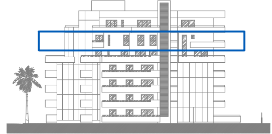
Escalera 2 Planta 5 o -2