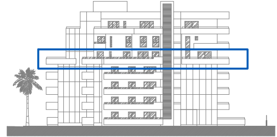
Escalera 1 Planta 4º-1